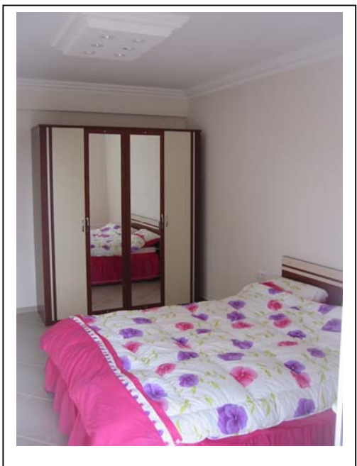
Hovedsoverom med dobbel-seng. Eget bad til hovedsoverom. Egen balkong til hovedsoverom.