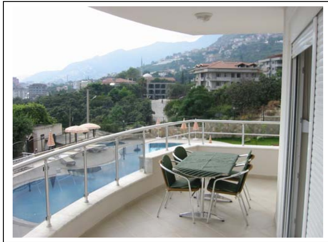
Hovedbalkong utenfor stue. God plass til bord, stoler og solsenger. Ute grill i ene hjørnet. Utsikt over bassenget og byen.