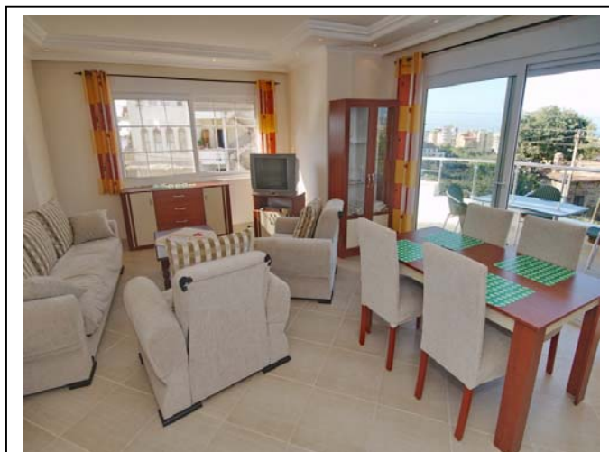
Stue med sofa bord og stoler. TV med satelittkobling.