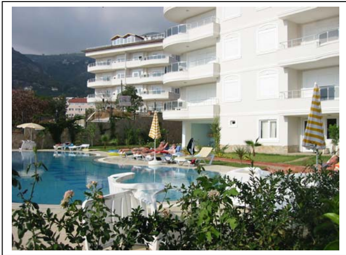
Bassengområde med hage og fellesareal. Solsenger og parasoller kan benyttes fritt. 130m2 basseng med fast dybde på 1,6m. Lite barnebasseng i tillegg