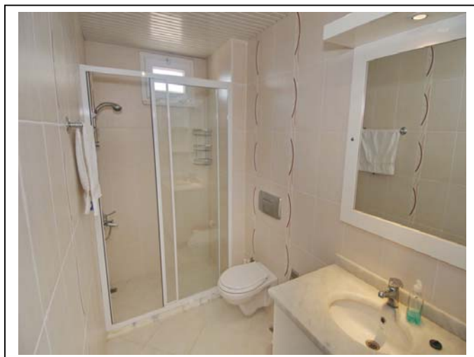
Det er to bad med dusj i leiligheten. Begge bad er flislagte og har varmekabler.