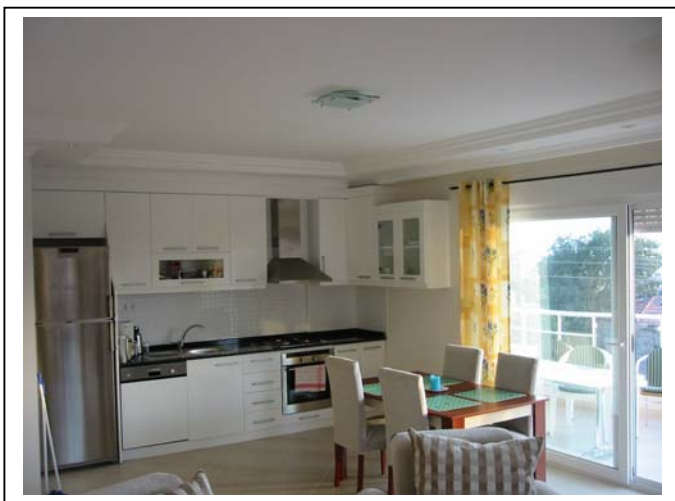
Åpen kjøkkenløsning. Kjøle/fryseskap, oppvaskemaskin, spisebord med 6 stoler.